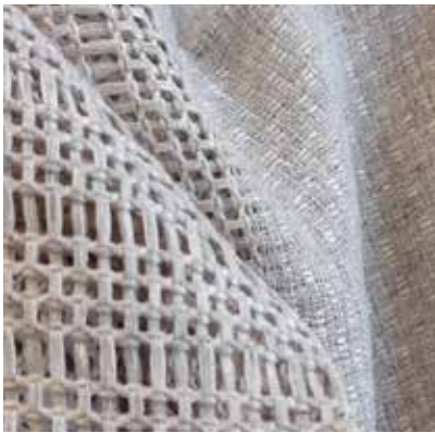
TEJIDO LINES UR 0451 100% poliéster Ancho 305 cm

TEJIDOS PARA VISILLERÍA DISEÑOS ITALIANOS - EXCELENTE TEXTURA Y CAÍDA