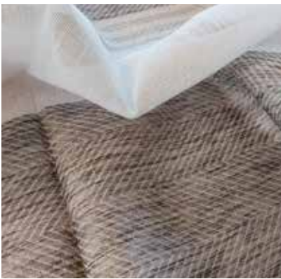
TEJIDO ROPES UJ 1696 100% poliéster Ancho 305 cm