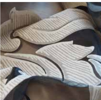
TEJIDO WEST UD 0300 81% viscosa / 19% poliéster Ancho 300 cm