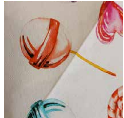
TEJIDO ENJOY US 1320 100% poliéster Ancho 320 cm