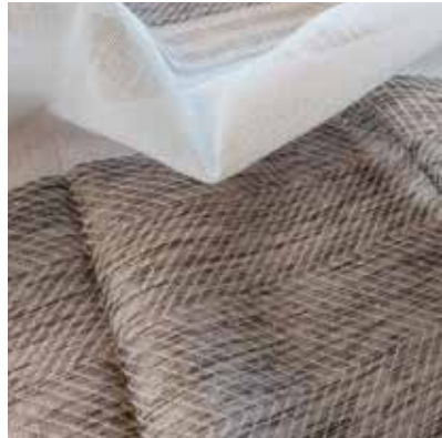
TEJIDO BRENTON UE 8208 50% poliéster / 50% lino Ancho 330 cm