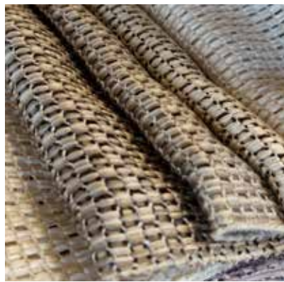
TEJIDO SNAKE UE 8194 100% poliéster Ancho 300 cm