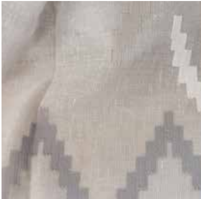
TEJIDO BLOOM UA 6088 94% poliéster / 6% lino Ancho 295 cm

TEJIDOS PARA VISILLERÍA DISEÑOS ITALIANOS - EXCELENTE TEXTURA Y CAÍDA