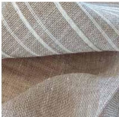
TEJIDO LILY UR 0452 100% poliéster Ancho 305 cm