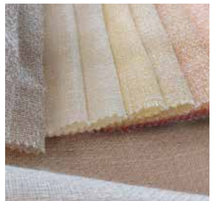
TEJIDO HONEY UJ 1706 86% poliéster / 14% lino Ancho 330 cm