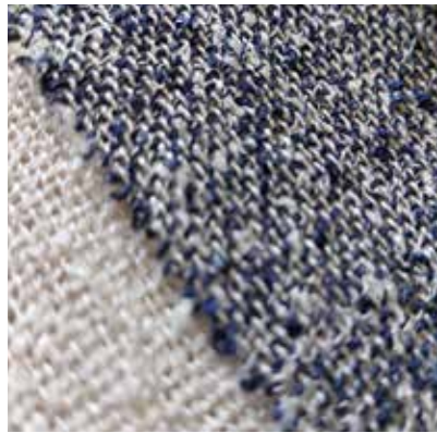
TEJIDO LOVIA UE 8199 69% poliéster / 31% viscosa Ancho 320 cm