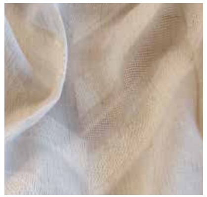
TEJIDO TITANIA UJ 1698 84% pes / 11% alg/ 5% lino Ancho 300 cm