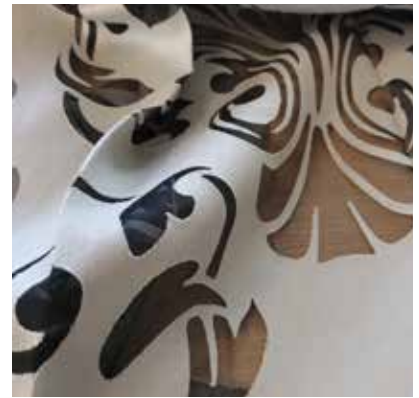
TEJIDO RAVEN UD 0301 84% viscosa / 16% poliéster Ancho 300 cm