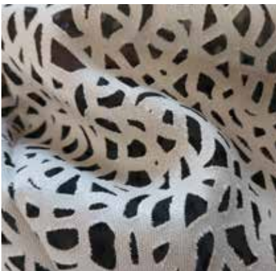
TEJIDO KAIROS UD 0313 84% viscosa / 16% poliéster Ancho 300 cm