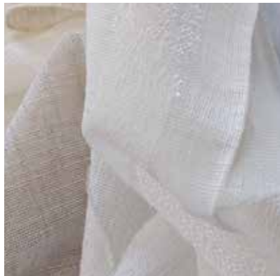
TEJIDO FUTURE UJ 1701 100% poliéster Ancho 305 cm