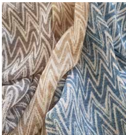
TEJIDO BEATRIX US 1314

DISEÑOS ITALIANOS EXCELENTE TEXTURA Y CAÍDA