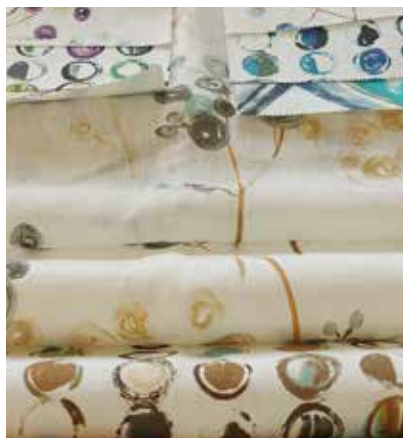
TEJIDO LEVANZO UX 1811 (apto para tapicería) Algodón 56% - Pes 44% Ancho CM 320 Ciclos 30.000 Tratamiento Water-Clean Más información >>