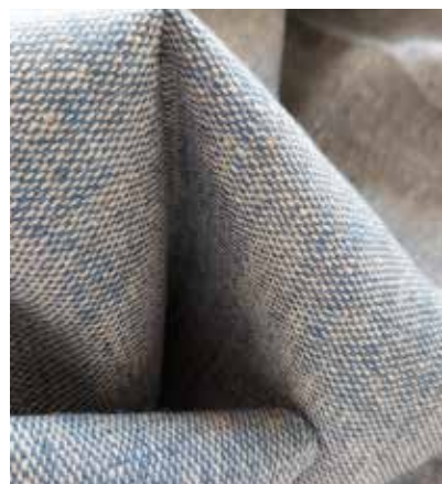
TEJIDO GIORGINA UT 4129 (apto para tapicería) Lino 63% - Viscosa 37% Ancho CM 280 Ciclos 15.000 Más información >>