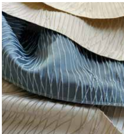
TEJIDO IMANI UG 1363 Poliéster 100% Ancho CM 295 Más información >>