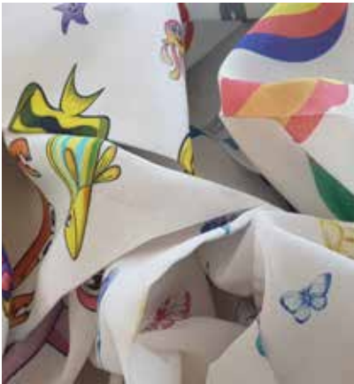
TEJIDO LUNA PARK US 1311

DISEÑOS ITALIANOS EXCELENTE TEXTURA Y CAÍDA