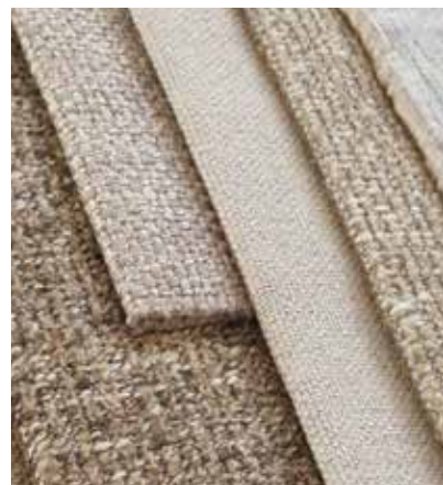
TEJIDO VILNIUS: BICE, EGLA, ERICA, GELSOMINA, GIACINTA, MILA (apto para tapicería) Ancho CM 140 Ciclos de 30-100.000 Más información >>