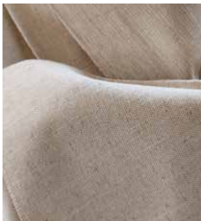
TEJIDO NATURALI SANFOR: ATACAMA, GOBI, KALAHARI, KARAKUM, KAVIR, NAMIB, SAHARA (apto para tapicería) Ancho CM 280 Ciclos: 10-15.000 Más información >>