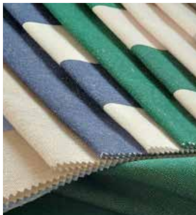
TEJIDO SUN OUTDOOR UF 0027 (especial para exterior) Acrílico 100% Ancho CM 160 Más información >>