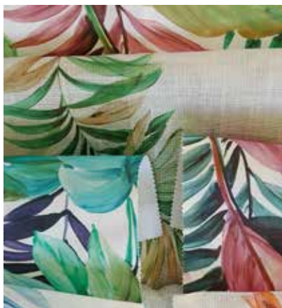
TEJIDO MARETTIMO UX 1812 (apto para tapicería) Algodón 56% - Pes 44% Ancho CM 280 Ciclos 15.000 Tratamiento Water-Clean Más información >>

MÚLTIPLES ACABADOS PARA DIFERENTES APLICACIONES TEXTURAS Y COLORES DELICADOS