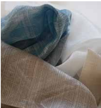
TEJIDO MELBOURNE UJ 1670

Lino 50% - Pes 50% Ancho CM 320 peso Más información >>