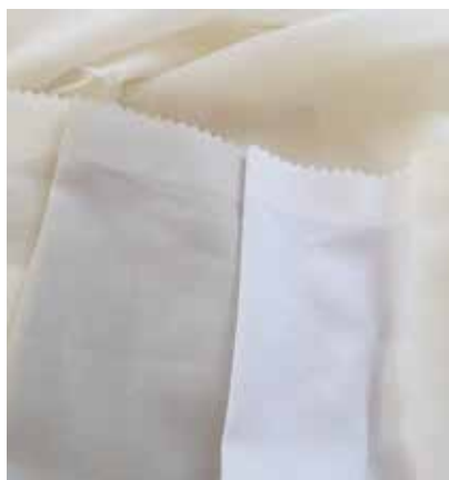
TEJIDO IERANTO UE 0495

Pes 80% - Lino 20% Ancho CM 320 peso Más información >>