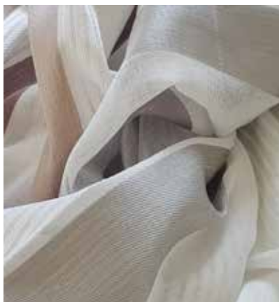
TEJIDO DALIA UJ 1690

Poliéster 100% Ancho CM 300 peso Más información >>