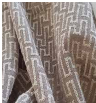
TEJIDO ZACK UA 6063

Poliéster 94%- Lino 6% Ancho CM 330 peso Más información >>