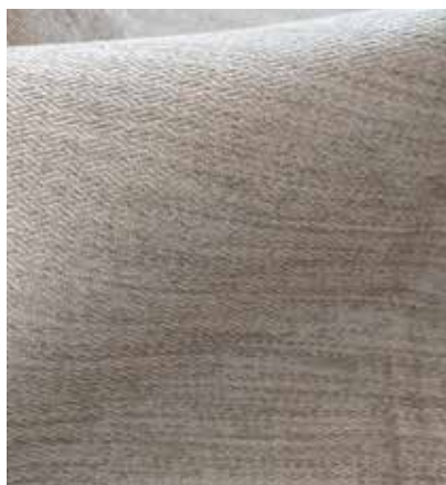
TEJIDO COLAMIINA UH 1007 (opaco) Poliéster 100% Ancho CM 300 Más información >>

MÚLTIPLES ACABADOS PARA DIFERENTES APLICACIONES TEXTURAS Y COLORES DELICADOS