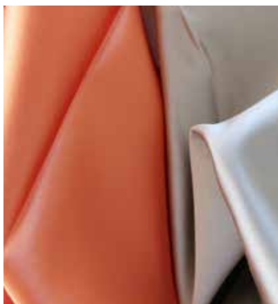
TEJIDO FILIPPO II UT 4101 (apto para tapicería) Poliéster 100% Ancho CM 300 Ciclos 12.000 Más información >>