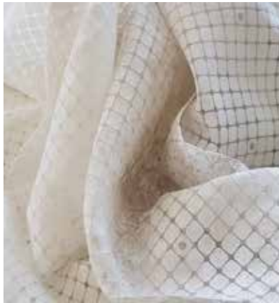
TEJIDO MANCHESTER UD 0279

Poliéster 100% Ancho CM 320 peso Más información >>