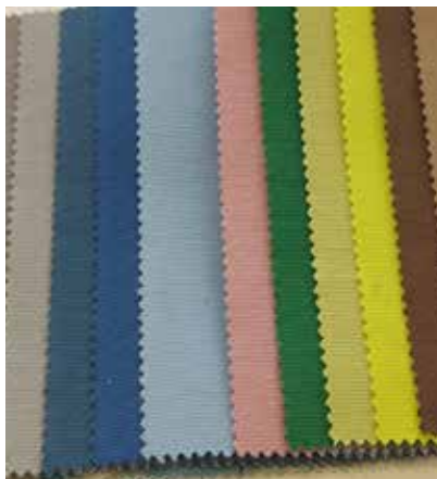
TEJIDO ROMA UT 4068 (apto para tapicería) Algodón 56% - Pes 44% Ancho CM 320 Ciclos 30.000 Tratamiento Water-Clean Más información >>