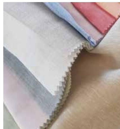
TEJIDO ERCHIE UE 8175

Poliéster 100% Ancho CM 300 peso Más información >>