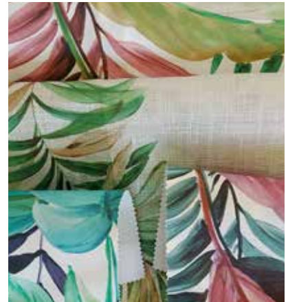
TEJIDO MARETTIMO US 1308

Rayón 81%-Pes 19% Ancho CM 300 peso Más información >>