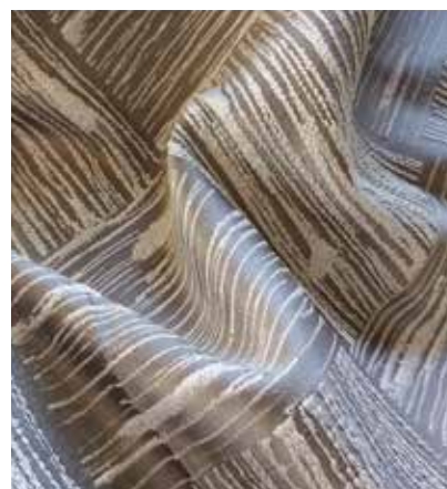
TEJIDO TUMA UG 1364 Poliéster 100% Ancho CM 295 Más información >>