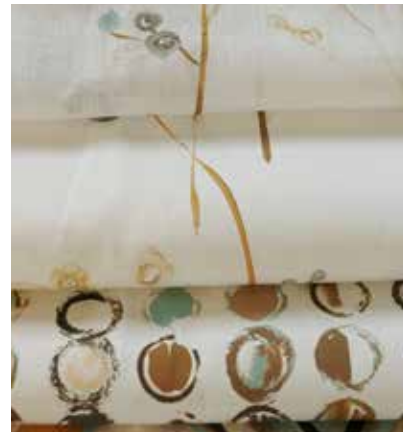
TEJIDOS LEVANZO US 1307

Viscosa 73% - Pes 27% Ancho CM 320 peso Más información >>