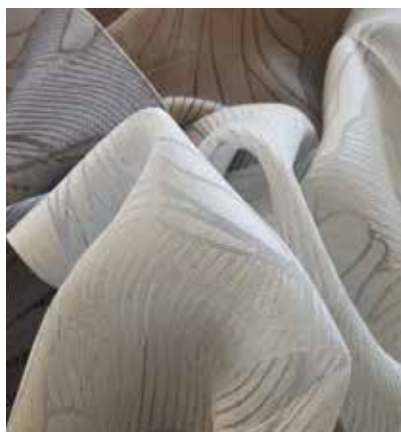
TEJIDO LEON UX 1811

Poliéster 100% Ancho CM 295 peso Más información >>