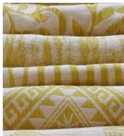
TEJIDOS LUBIANA UG 1316 Poliéster 92% - Lino 8% Ancho CM 280 Más información >>